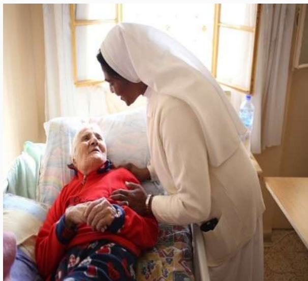
Ouderenzorg door de Antonian Charitable Society

Helaas zijn de onderdelen van dit conflict voor de meeste van ons niet onbekend. De situatie herhaalt zich en langzaam verslechtert de situatie van velen. Het Heilig Land wordt gekenmerkt door structureel geweld, ernstige mensenrechtenschendingen en een toenemende kwetsbaarheid van religieuze minderheden, waaronder christenen. Zonder duurzame politieke hervormingen en effectieve internationale betrokkenheid blijft het vooruitzicht op langdurige stabiliteit beperkt.